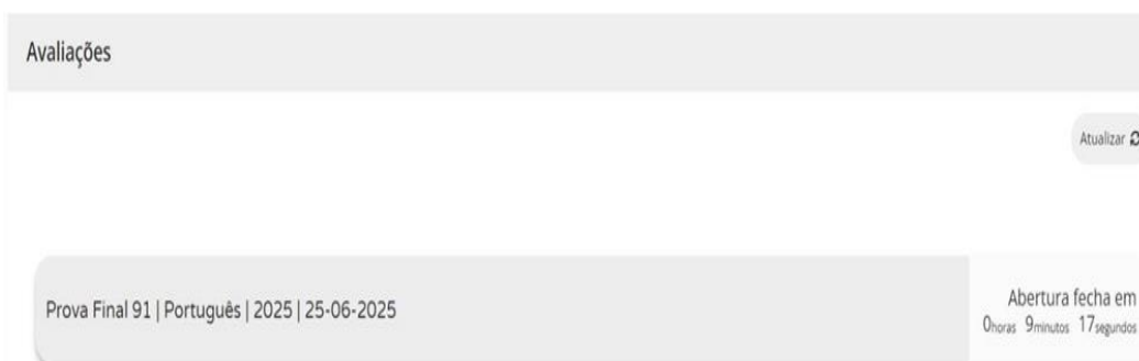
Figura 2 – Acesso à prova a realizar

Nas provas, ao clicar em “Iniciar sessão”, por exemplo, para um aluno que realiza a prova final de Português (91), aparece o seguinte ecrã: