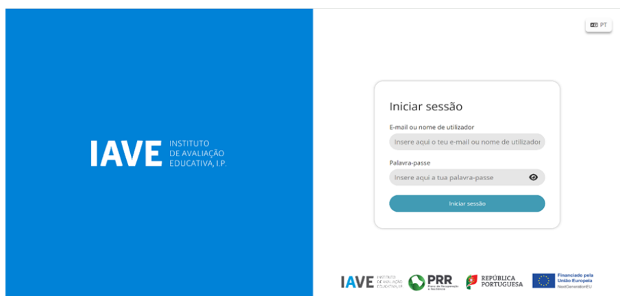
Figura 1 – Acesso à Plataforma de Realização de Provas do IAVE

Os professores vigilantes podem, em caso de necessidade, introduzir as credenciais no computador do aluno, para que este consiga aceder à prova.